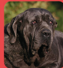
Mâtin de Naples