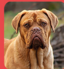
Dogue de Bordeaux